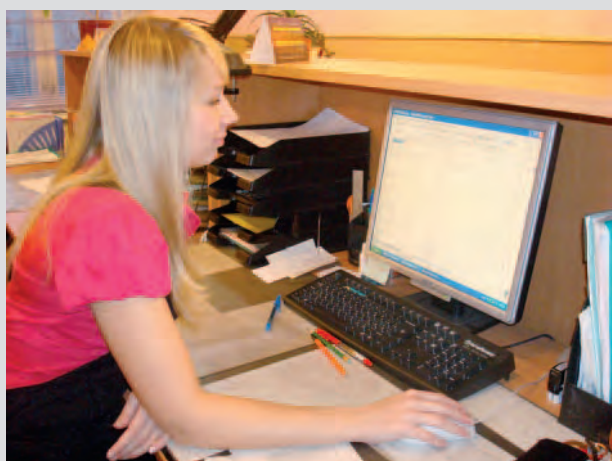
За день приема бухгалтер ООО «Теплоэнергосервиса» принимает по 50 человек, с терпением, с вниманием и улыбкой!

Бухгалтера! Ваш труд не оценим! Вы так серьезны, вдумчивы и строги. И правят вами господа незримые: Инструкции, отчеты и налоги. Пускай улыбки ваши расцветут, Душа по-молодому вострепнется. Любимые! Спасибо, вам за труд! Пусть вам легко и счастливо живется!