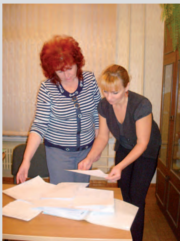
Каждое обращение клиента обязательно регистрируется, спустя годы сотрудницы бухгалтерии «ТЭС» без труда ответят вам, в каком месяце какого года вы получили перерасчет, потому что были в отпуске! Такой строгий учет и контроль нужен для того, что бы анализировать заявления клиентов. На основе этого анализа «ТЭС» постоянно вносит изменения в свою работу.

- Первая задача – это начисление квартирной платы. Если в нашем городе 20 000 квартир, значит, ровно такое количество счетов в месяц наш отдел и должен сделать. При этом обязательно следует учесть льготы, перерасчеты и субсидии, показания водо- и электросчетчиков, безналичную оплату. Что бы оперировать такими огромными потоками информации необходимо четкое взаимодействие не только между отделами «Теплоэнергосервиса», но и со сторонними организациями. Например, если нашей компанией проводились ремонтные работы и собственники не получили услуги, то мы делаем перерасчет автоматически, опираясь на акты нашей же аварийно-диспетчерской службы. Это удобно, ведь жильцам самим не нужно обращаться с заявлениями по этому поводу. К нам на электронную почту поступает информация о безналичных списаниях кварплаты с