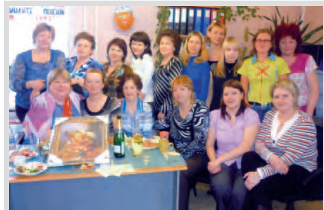
Поздравляем дружный коллектив бухгалтерии ООО «Теплоэнергосервис» с профессиональным праздником.